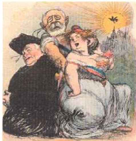
« La Situation de l'Etat et de l'Eglise », cartoon du Journal Le Rire, 20 mai 1908